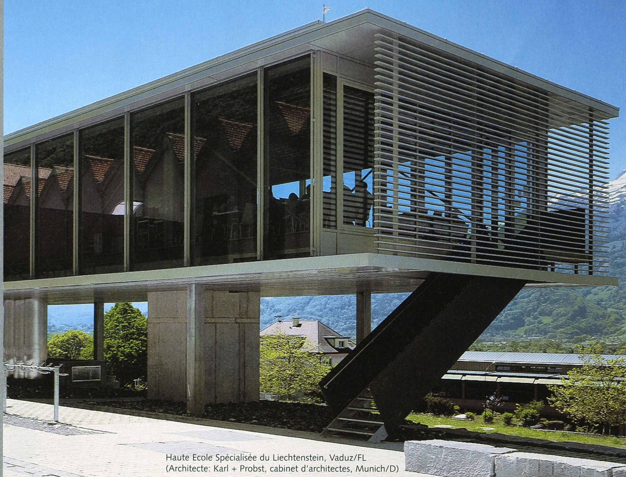
Haute Ecole Spécialisée du Liechtenstein, Vaduz/FL (Architecte: Karl + Probst, cabinet d'architectes, Munich/D)

Des solutions avec des systèmes innovants