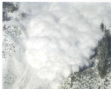
Avalanche dans la Vallée de la Sionne