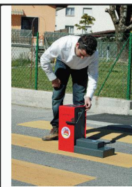
Essais sur marquages routiers