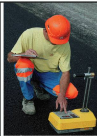
Suivi de mise en oeuvre