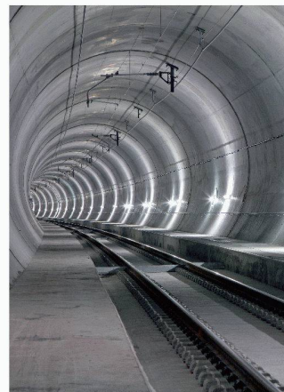
Tunnel de base du Lötschberg