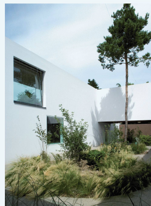
Patio d'une unité d'habitation de la Residence de la Rive, à Onex

Principes pour la conservation du patrimoine bâti en Suisse Bernhard Furrer