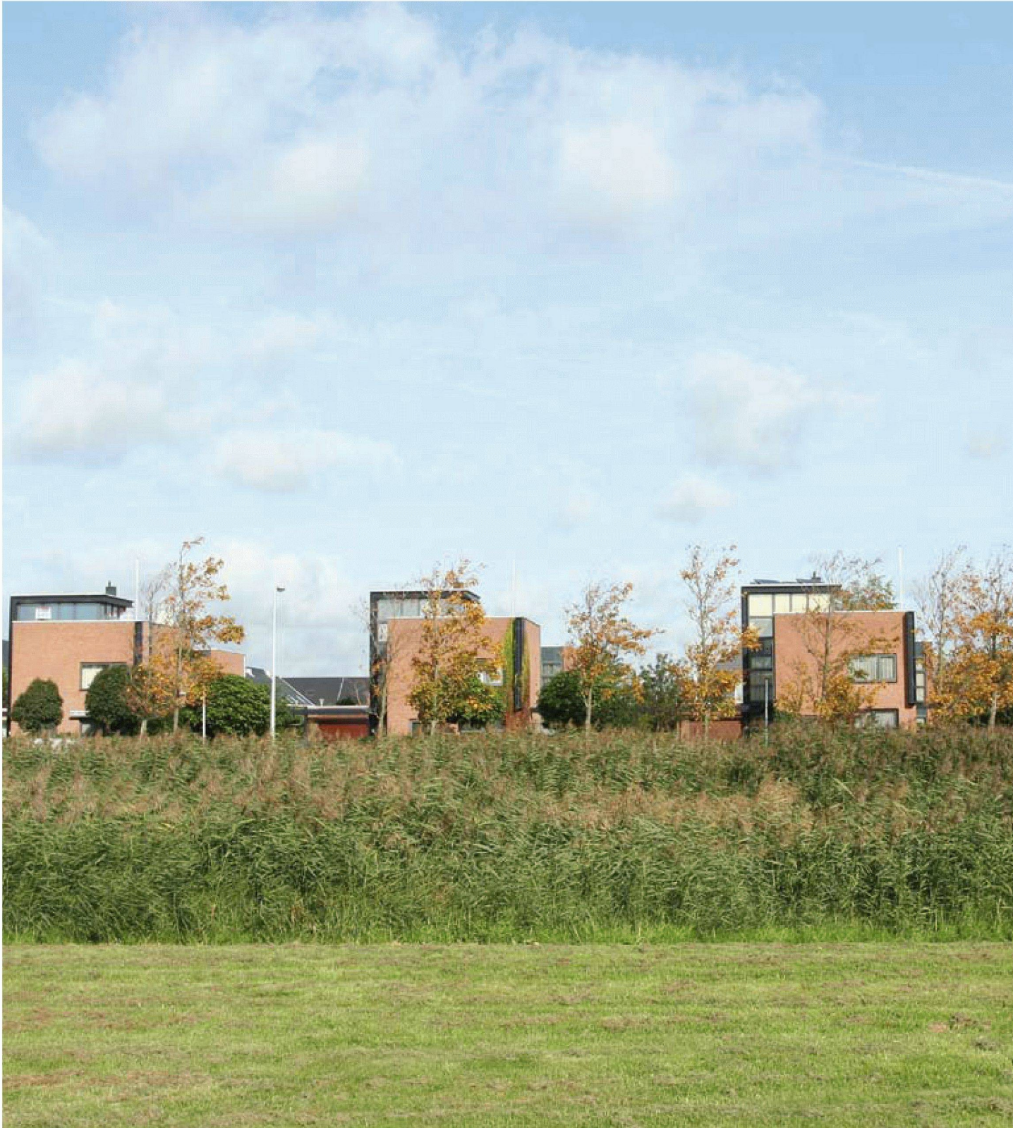
Fig. 2 : Vue d'« Ypenburg » : ambiance campagnarde dans un environnement urbanisé

Fig. 1 : La plupart des logements « Vinex » (ici « Ypenburg », construit entre 1997 et 2007) sont entourés de généreux espaces verts tout en jouissant d'un jardin privé. Malgré cela, la densité peut en l'occurrence être quatre à huit fois supérieure à celle de certains quartiers de villas suisses.