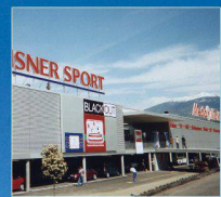
Media Markt, Conthey