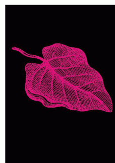
Cocculus lacinoeus (Document Atelier Poisson)

Projets primés du concours international Francesco Della Casa