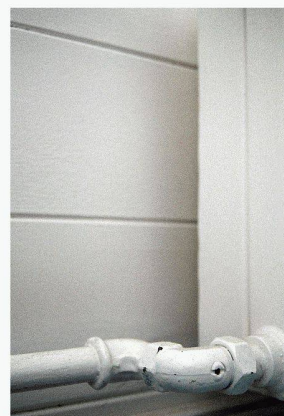
Canalisation de chauffage

Normes et cahier technique pour économiser l'énergie Martin Lenzlinger, Charles Weinmann, Gerhard Zweifel et Urs Steinemann