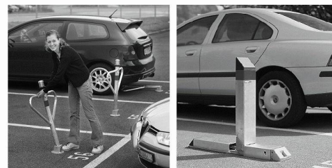
Robustes et fiables: «Autopa» (manuel) et «CityParker» (automatique) gardent votre place de parking.

Votre partenaire aux services de qualité et solutions innovantes.