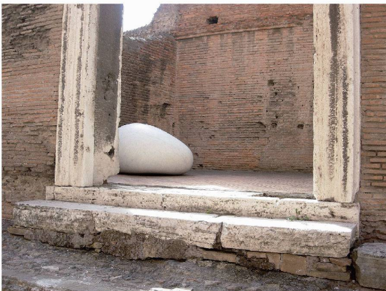
Les œufs du temps

Marché de Trajan et Musée des Forums Impériaux Via IV Novembre 94 Jusqu'au 30 mars 2008 Ouvert tous les jours de 9h à 18h. Fermé le lundi