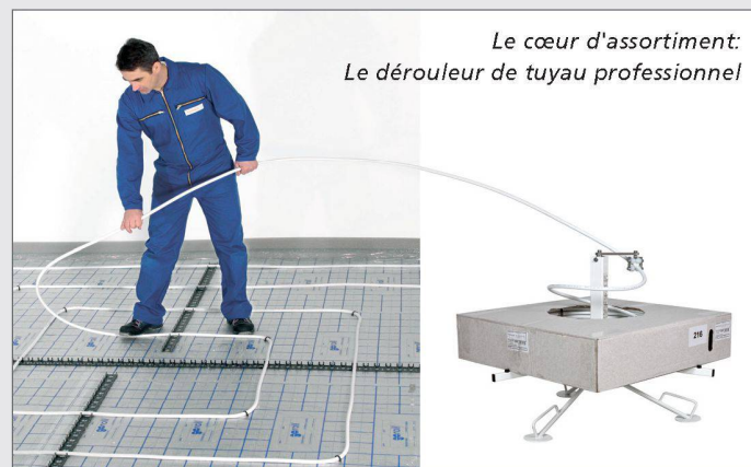
Le cœur d'assortiment: Le dérouleur de tuyau professionnel

A côté de la qualité de service éprouvée, Prolux souligne ainsi sa compétence dans le domaine des chauffages rayonnants.