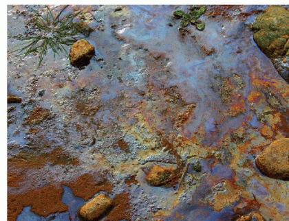
Sal contaminé