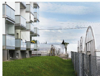
Paysage de périphérie

Nouveaux espaces publics : les projets d'Europan 9 en Suisse Francesco Della Casa