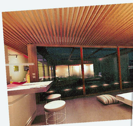
Vue plongeante sur le living depuis la cuisine.

Une maison, c'est l'aboutissement d'un rêve. Spécialiste suisse de la construction, notre groupe est là pour lui donner vie. Bois, parquets, carrelages, matériaux, salles de bains, cuisines, appareils ménagers et aménagements extérieurs, l'habitat est notre métier. Et une passion que nous exerçons depuis plus de 150 ans, toujours à l'affût des nouvelles tendances. Car la tradition n'empêche pas l'innovation. N'hésitez pas à nous confier vos projets, nous en ferons une belle maison. Rendez-vous dans nos expos.