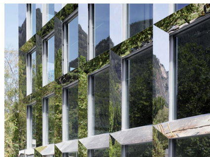
Façade de l'école professionnelle du Haut-Valais à Visège, Bonnard & Woeffray Architects

Un atlas du logement on-line Cédric Bachelard