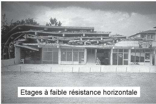
Etages à faible résistance horizontale