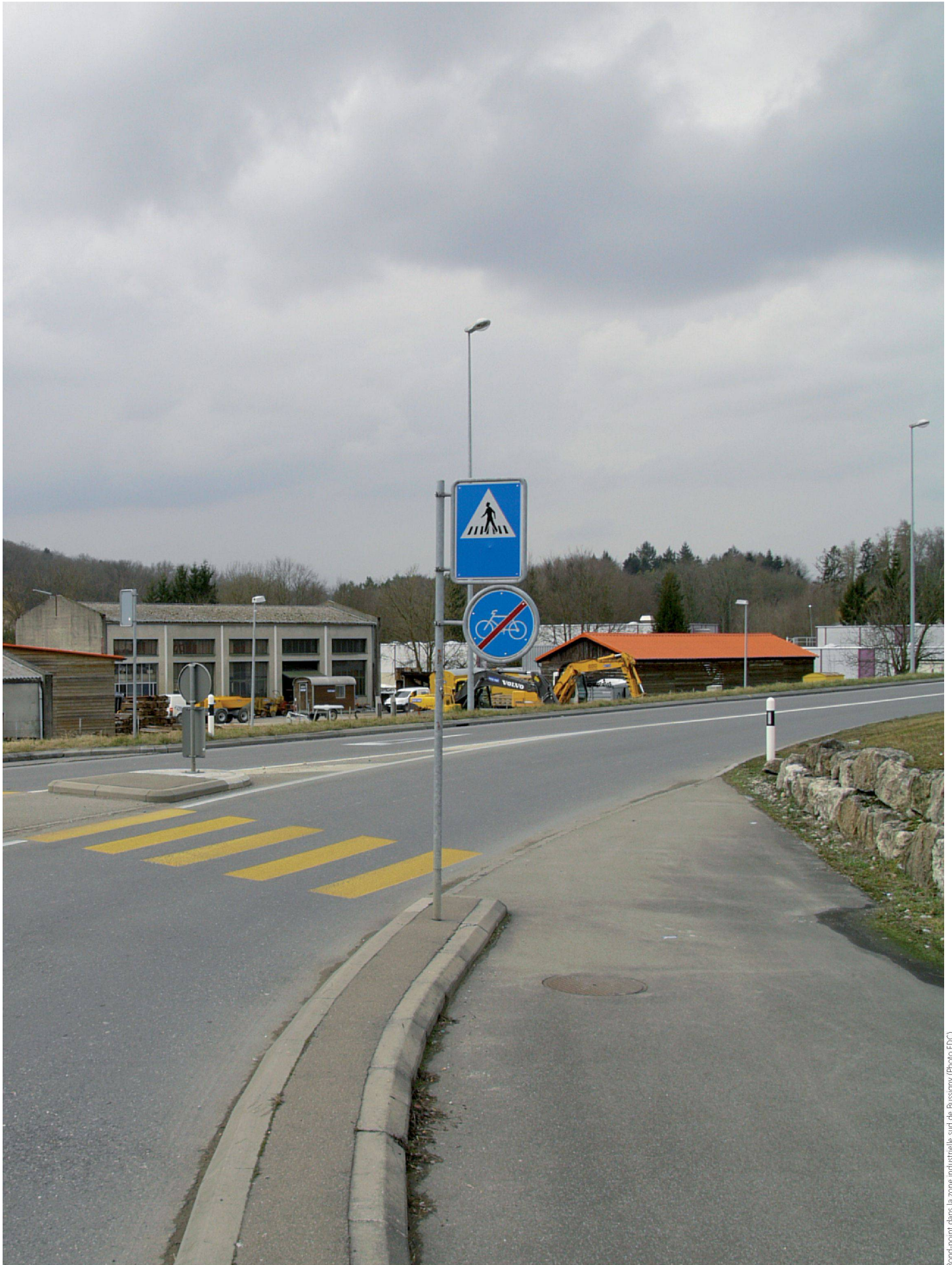
Rond-point dans la zone industrielle sud de Bussigny