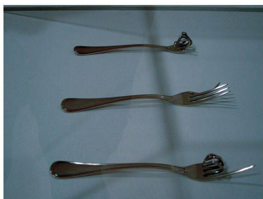
Des «Fourchettes parlantes» selon Munari