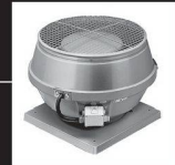
Ventilateurs de toits

30 Jahre Erfahrung Helios Ventilatoren AG Lufttechnik