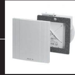
Système d'aération monogaine