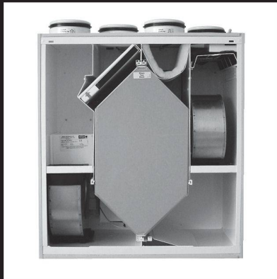
Système de ventilation avec récupération d'énergie