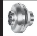
Ventilateurs pour gaines