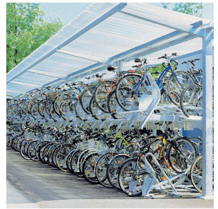
Des solutions intelligentes lorsque la place manque.

de façon optimale les abris et les installations de parc 2 roues autour des immeubles. En outre, Velopa s'est transformé depuis l'an 2000 de plus en plus en partenaire de fourniture pour marchés publics. De très nombreux parcs modernes de bicyclette dans les gares en sont le témoin. Grâce à des systèmes de produit bien étudiés, Velopa peut réaliser la plupart des souhaits des clients individuels en assemblant des pièces normalisées de conception modulaire. Cela rend les produits économiques et permet de courts délais de livraison.