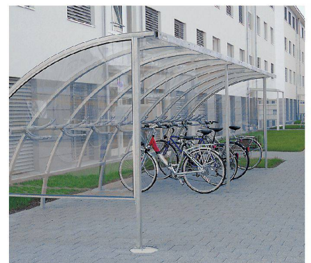
Élégante et filigrane : La couverture « Oméga ».

Entraîné par le développement du secteur bicyclettes et de la mobilité, Velopa a aussi des « cordes futuristes » à son arc. Nous évoquons ici en exemple les nouveaux systèmes d'accès ainsi que l'électro-vélo. En outre, l'entreprise rayonne entre-temps au niveau international. Velopa France a été constitué en 1997, et depuis avril 2009 la filiale « 1a-parken » est opérationnelle à Rheinfelden en Allemagne.