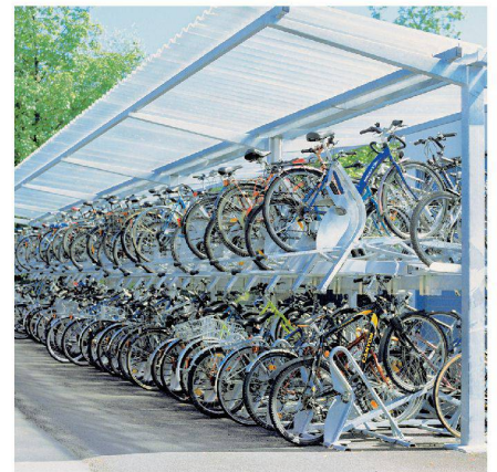
Des solutions intelligentes lorsque la place manque.

de façon optimale les abris et les installations de parc 2 roues autour des immeubles. En outre, Velopa s'est transformé depuis l'an 2000 de plus en plus en partenaire de fourniture pour marchés publics. De très nombreux parcs modernes de bicyclette dans les gares en sont le témoin. Grâce à des systèmes de produit bien étudiés, Velopa peut réaliser la plupart des souhaits des clients individuels en assemblant des pièces normalisées de conception modulaire. Cela rend les produits économiques et permet de courts délais de livraison.