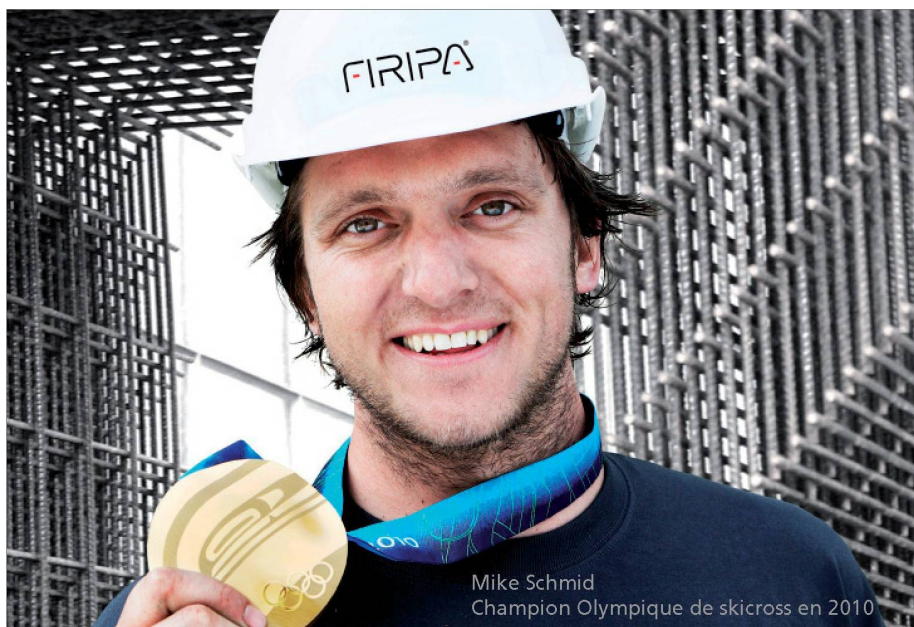
Mike Schmid Champion Olympique de skicross en 2010

3form AAK Die Holzmanufaktur Alias Aqua Creations Arper atelier oï Axor – Hansgrohe by Ronan und Erwan Bouroullec & ECAL Baltensweiler Bauwerk Parkett Belux Bernische Stiftung für angewandte Kunst und Gestaltung BFR LAB Bigla BLICKFANG Internationale Designmesse für Möbel, Mode und Schmuck Chamäleon Design Creaplant Création Baumann de Sede Denz Design Preis Schweiz Dietiker Duravit FHNW, Hochschule für Gestaltung und Kunst, Institut Industrial Design, Aarau Gramazio & Kohler, Architektur und Digitale Fabrikation, ETH Zürich FHNW, Hochschule für Gestaltung und Kunst, Institut Innenarchitektur und Szenografie, Basel Forbo Giubiasco Forster Küchen Foscarini fries & zumbühl Girsberger Glas Trösch greutmann bolzern designstudio Haute école d'art et de design, Genève Hector Egger Holzbau Hochschule Luzern, Design & Kunst, Produktdesign Hydroplant ims Industrial Micro Systems Intertime Irion Jörg Boner productdesign Keramik Laufen, Similor Kramis Lehni Licht+Raum Lista Office Marburger Tapetenfabrik MDT Montana Montis & Christophe Marchand Design Moobel Neuco Neue Werkstätte NFS New Flooring Systems nut+grat Penrose Wooden Flooring RADAR Regent Lighting Röthlisberger Kollektion Royal Mosa Ruckstuhl schindlersalmerón Stahlblau teo jakob Thut Möbel Tossa USM Möbelbausysteme Vifian Möbelwerkstätten Vitra Wood & Washi XAL Xenon Architectural Lighting Zürcher Hochschule der Künste ZHdK, Industrial Design Zumtobel