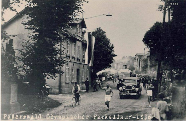
3 Peterswald Olympischer Fackellauf-1936