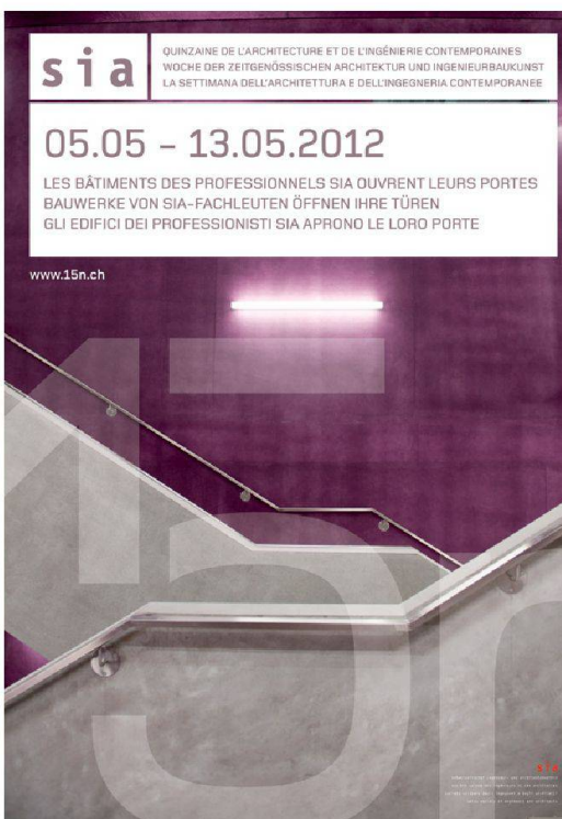
in 18, graphisme & webdesign

Sur la base d'expériences internationales et suisses, la journée d'étude « Bétons fibrés ultra-performants : concevoir, dimensionner et construire », organisée conjointement par l'Ecole d'ingénieurs et d'architectes de Fribourg et l'Ecole polytechnique fédérale