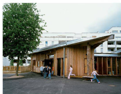
Salle de classe à l'école du Haut-Bois

Bâtir pour une éducation en extérieur Laila Wernli