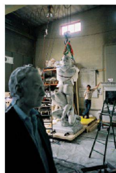
Une œuvre d'Urs Fischer pour la Biennale de Venise en production au Sitterwerk