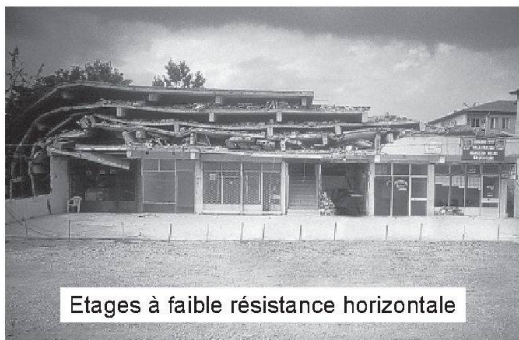
Etages à faible résistance horizontale