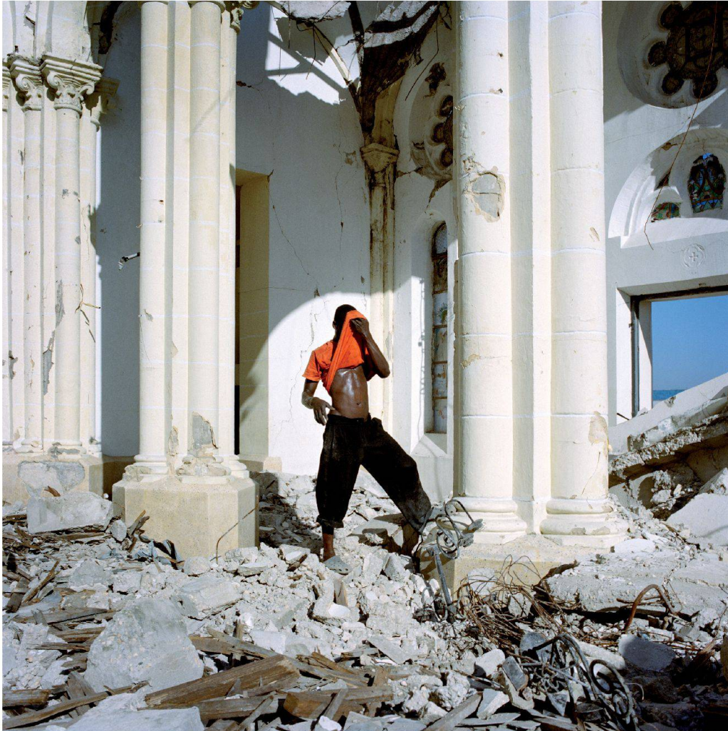
Fig. 8 : Intérieur de la cathédrale de Port-au-Prince. Dans les débris, les cantonniers récupèrent les structures de fer pour les revendre.