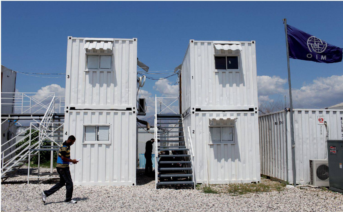
Fig. 2 : Base logistique de l'ONU