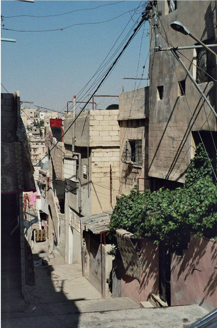
Fig. 6 : Entrée du réseau d'électricité dans le camp al-Husseïn à Amman