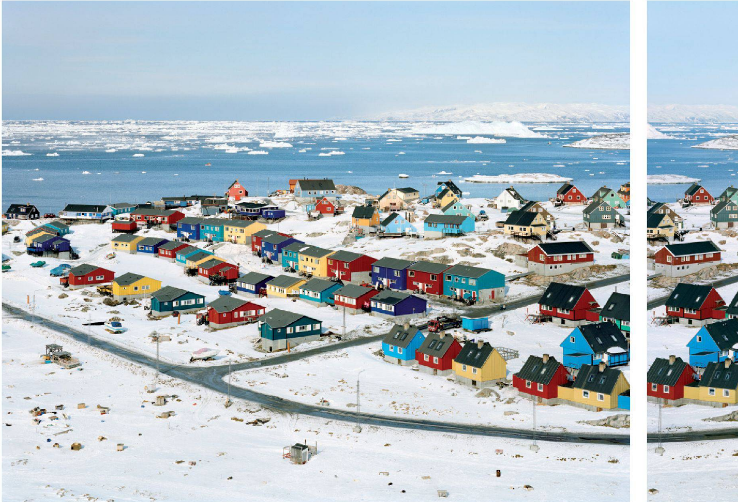
Fig. 6 : « Untitled images from the studies Ilulissat / Greenland », 2010 (Diptyque Joël Tettamanti)