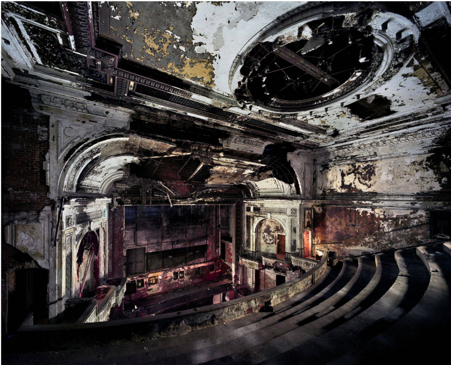
Fig. 9 : Détroit, National Theater, construit par Albert Kahn en 1911