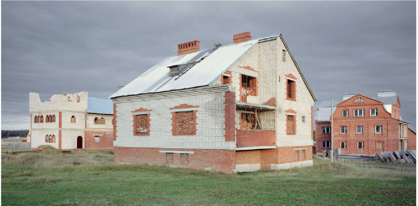
Fig. 6 : Détroit, 2002