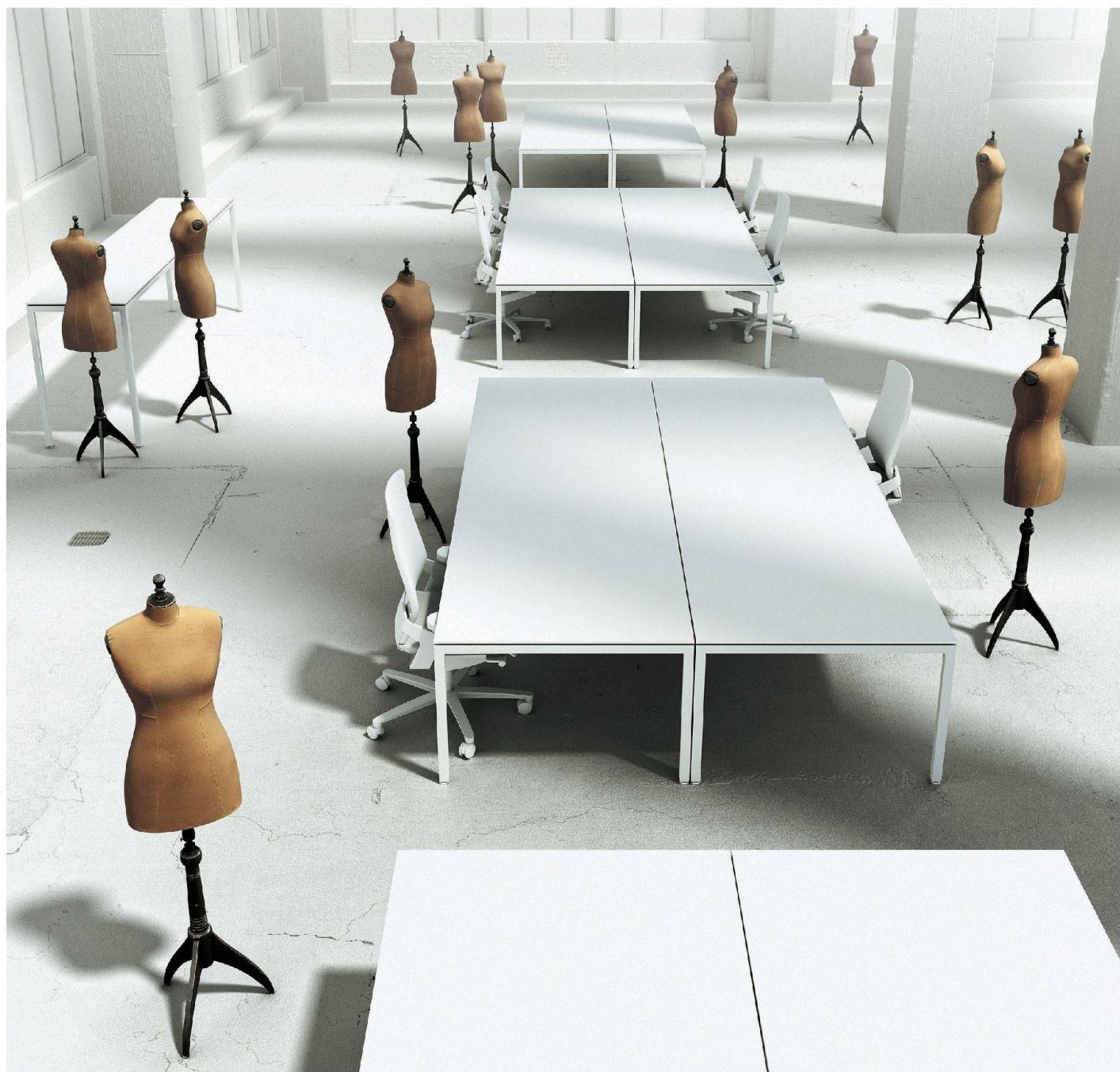
Système de tables LO Motion

Lista Office LO près de chez vous > www.lista-office.com/distribution