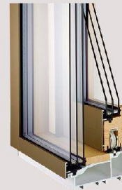
Portes coulissantes bois/métal de la marque Meko.