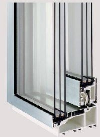
Portes coulissantes métalliques de la marque Schweizer.

Portes coulissantes et vitrages grand format et à haute isolation, profilés extra-minces et fabrication de première qualité, avec, en outre, un grand confort d'utilisation et des valeurs U jusqu'à 0,59 W/(m 2 K). Notre conception de la technique des fenêtres!