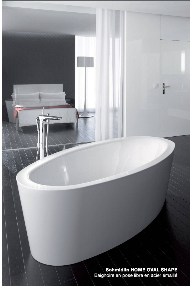
Schmidlin HOME OVAL SHAPE Baignoire en pose libre en acier émaillé

Entrée en fonction de suite ou à convenir