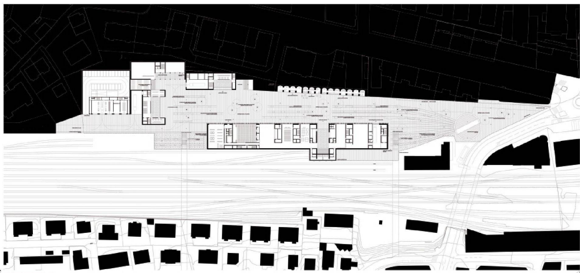
6 PLAN GÉNÉRAL DU REC DE CHASSE 1500

L'intérêt n'est pas tant dans la valeur patrimoniale des édifices, que dans l'éthique et l'enseignement qui émane de leur reconversion. Une société qui sait s'accommoder de ces