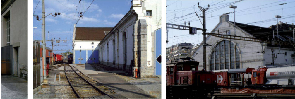
Fig. 7 à 14: Vues du site et la vue depuis le site