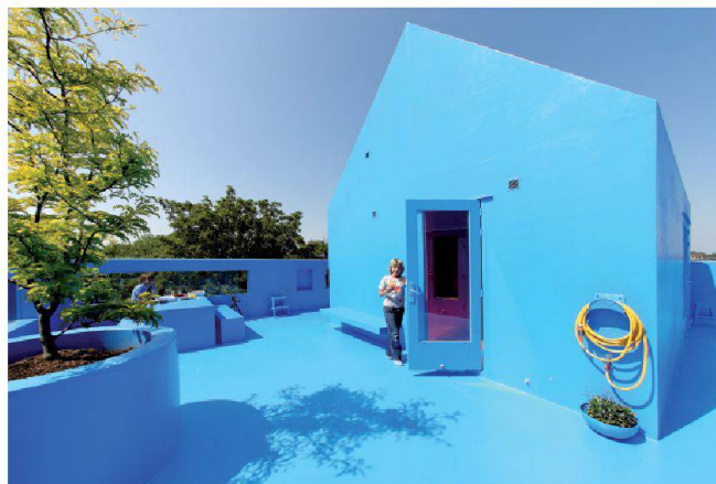
Didden Village. Prothèse d'habitation sur le toit d'un immeuble de Rotterdam