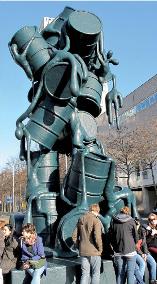
Monument à l'industrie pétrolière face à la bourse de Rotterdam