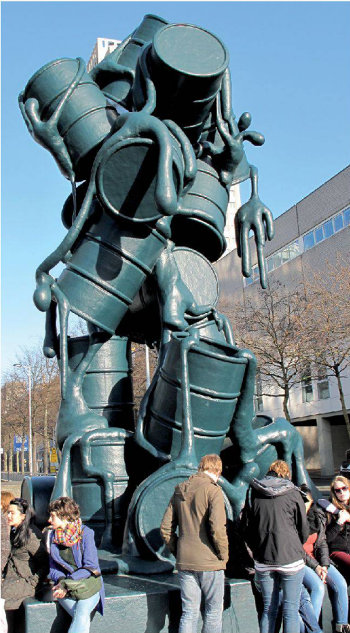
Monument à l'industrie pétrolière face à la bourse de Rotterdam