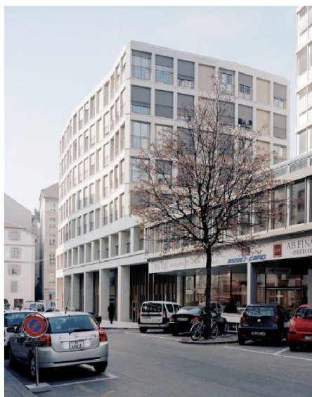
Le nouvel immeuble de la rue du Cendrier, à Genève, abrite 17 logements, une crèche et un bureau d'accueil familial.