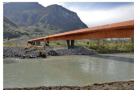
La ligne rouge