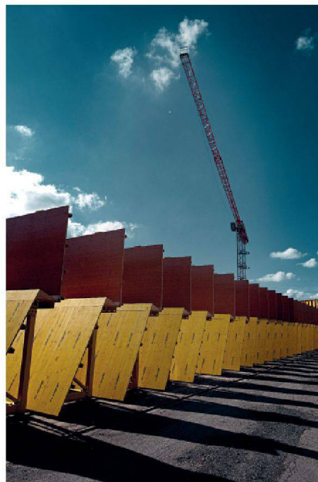
Panneaux de coffrage prêts à l'emploi