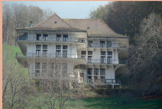
Le Pont, villa Hauteroche

Canton de Vaud www.patrimoine.vd.ch et Suisse www.nike-kultur.ch