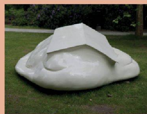
Erwin Wurm, Melting House II

Vitra Design Museum Charles-Eames-Str. 2 D – 79576 Weil am Rhein www.design-museum.de