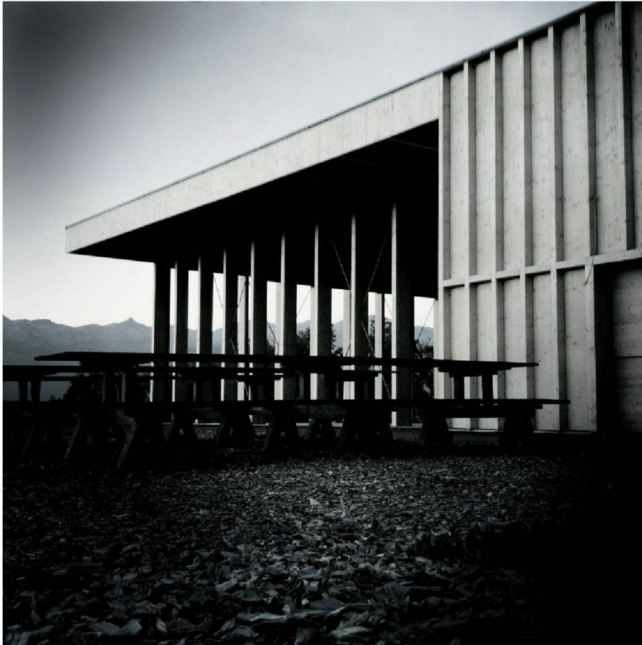
Le Forum Mont-Noble à Nax

Parmi les 61 projets romands soumis au Prix Lignum 2012, le jury a couronné le Forum Mont-Noble à Nax (VS). Le deuxième et le troisième Prix ont été respectivement remis à la nouvelle salle de sport d'Attalens (FR) ainsi qu'au nouveau hangar agricole à Lignièrès (NE).