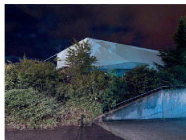
groupes, Halle logistique du CCR, Genève, 2011

Les Prés-de-Vidy Concours pour un complexe sportif et multifonctionnel