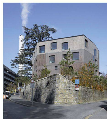
La villa Beaumont à Lausanne