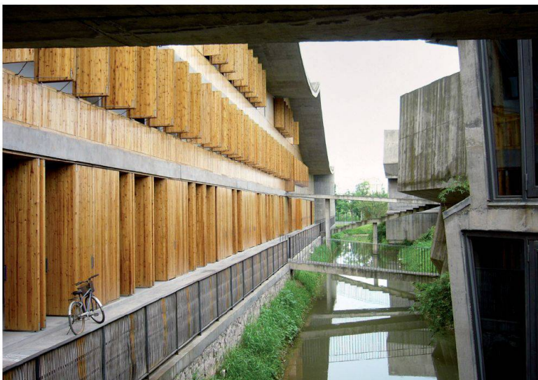
L'école des beaux-arts de Hangzhou, 2007

Dès lors, l'écho médiatique particulièrement faible qui suit la nomination de Wang Shu est peut-être bon signe. Le public semble échapper à l'inondation habituelle d'opinions convenues, et le principal protagoniste – par ailleurs lauréat, il y a cinq ans, du Global Award , le Prix international d'architecture durable –, a l'air de résister aux effets corrosifs des grandes distinctions. Le nom de son bureau en tout cas, Amateur Architecture Studio , dit bien que l'art de bâtir n'est pas la prérogative de quelques stars, et qu'il s'agit de se permettre de reprendre la réflexion à la base à chaque nouveau projet.