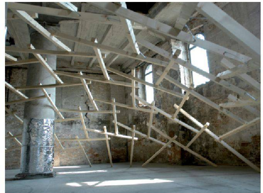
Decay of a Dome , installation de Wang Shu à la Biennale de Venise en 2010 (Image Lu Wenyu)

Hangzhou, Wang Shu a récupéré les matériaux des quartiers détruits alentour), l'importance accordée aux populations autochtones, à l'artisanat et au processus de construire en tant que tel seraient soudain devenus convenables au point d'être couronnés par le Pritzker.