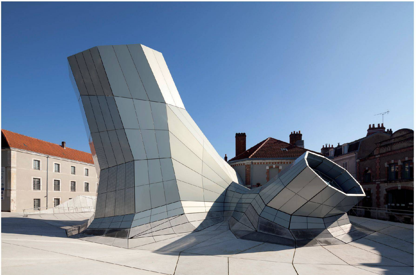
Les Turbulences - FRAC centre (© Jacob + MacFarlane. Photos Nicolas Borel)

L'inauguration la semaine dernière d'une extension du FRAC Centre à Orléans a été l'événement architectural et médiatique de la rentrée en France. Il est vrai que le projet conçu par le bureau Jakob + MacFarlane était attendu. Bâtiment-prothèse, Les Turbulences , qui culmine à 18 m, réorganise l'accès d'un bâtiment existant. Il fait preuve d'une grande irrévérence tectonique, sans pour autant verser dans la gesticulation gratuite.