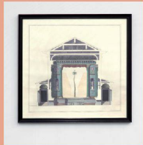
Pablo Bronstein. Dancing Girl on a Palm Tree, 2012.

EXPOSITION PABLO BRONSTEIN / A IS BUILDING, B IS ARCHITECTURE Centre d'art contemporain, Genève www.centre.ch