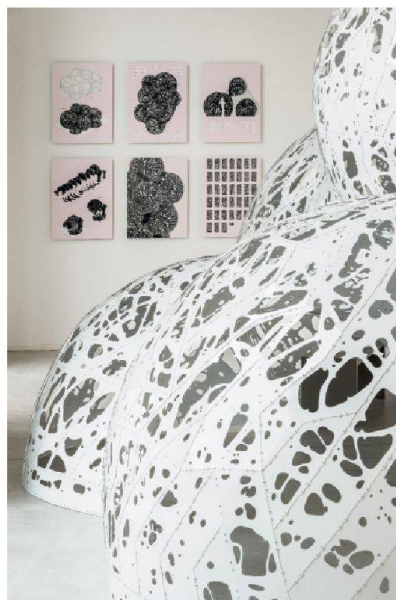
MARC FORNES & THEVERYMANY™, «Double Agent White», 2012 Exposition « ArchiLab - Naturaliser l'architecture »