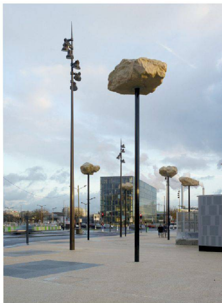
« Les Rochers dans le ciel » de Didier Marcel (© Mairie de Paris)