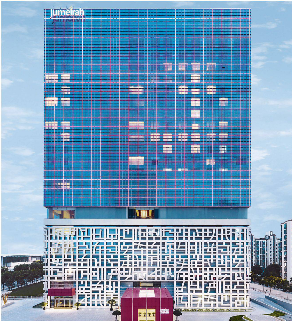
Jumeirah Hotel, Shanghai