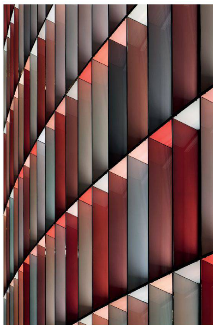
La composition polychrome du Saint-Georges Center